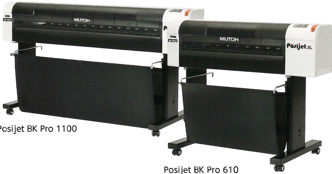
Posijet BK Pro 1100